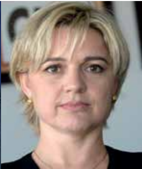
Prof. Dr. Selin Sayek Böke